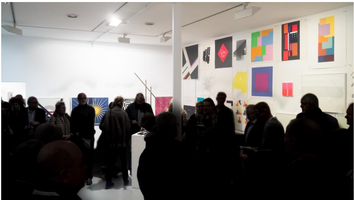
Raum 2 am Abend der Vernissage.